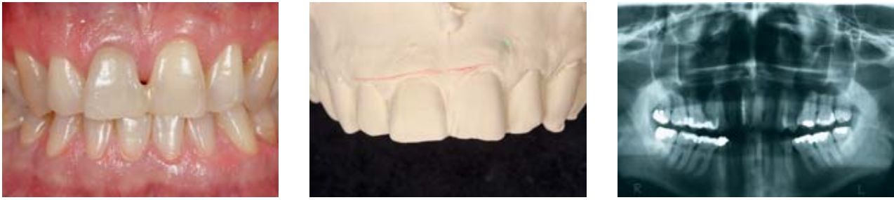
Abbildung 1–3 Das Röntgenbild der Ausgangssituation zeigt die querfrakturierte Wurzel an Zahn 11. Das asymmetrische Längen-Breiten-Verhältnis der beiden natürlichen Frontzähne stellt sich in der Ästhetikanalyse deutlich dar.

Figure: 1–3 The x-ray image of the initial situation shows the laterally fractured root at tooth 11. The asymmetrical ratio between the length and width of the two natural front teeth is clearly reflected in the esthetic analysis.