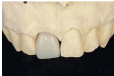
Figure 16, 17 An implant-supported transitional prosthesis was produced to form the soft tissue. For this purpose the implantation was moulded and the exact gingiva line was translated from the situation model to the master model.