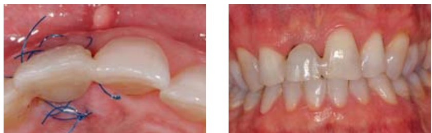
Abbildung 14, 15 Als provisorische Sofortversorgung diente die gekürzte natürliche Zahnkrone. Nach dem Verschließen der Dentinkanälchen wurde sie im Sinne einer Maryland-Brücke eingesetzt.

Figure 12, 13 To avoid a resorption of the vestibular lamella the jumping distance exceeding 1.5 mm was filled with Bio-Oss and the soft tissue deficit was sealed using a Bio-Gide membrane.