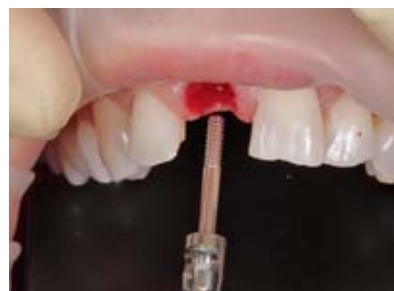
Figure 4, 5 After severing the Sharpey fibres the laterally fractured tooth was removed.