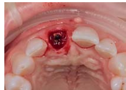
Abbildung 4, 5 Nach dem Lösen der Sharpeyschen Fasern wurde das koronale Zahnfragment entfernt.

Figure 4, 5 After severing the Sharpey fibres the laterally fractured tooth was removed.