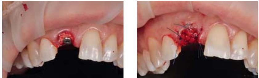
Abbildung 12, 13 Zur Vermeidung der Resorption der vestibulären Lamelle wurde die Jumping Distance, die größer als 1,5 mm war, mit Bio-Oss aufgefüllt und das Weichgewebedefizit mit einer Bio-Gide-Membran verschlossen.

Figure 8–11 With the immediate implantation in the anterior tooth region the pilot examination was performed on a slanted plane. With the following drilling protocol the axis was lifted, allowing the implant replacement for the esthetic reconstruction to be inserted at the exact position.