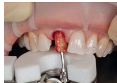
Abbildung 6, 7 Der Wurzelrest konnte mithilfe des Benex-Extraktors unter Erhalt der vestibulären Knochenlamelle atraumatisch gelöst werden.

Figure 6, 7 With the Benex-Extractor the rest of the root was removed maintaining the vestibular bone lamella and without damaging the tissue.