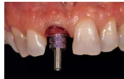
Abbildung 18–21 Die Übertragung des Emergenzprofils der provisorischen Versorgung in die definitive Restauration erfolgte mithilfe eines individualisierten Abformpfostens. Dazu wurde ein Silikonsschlüssel erstellt und der subgingivale Bereich aufgebaut. Ohne Verdrängung der ausgeformten Gingiva wurde die Abformung für die definitive Implantatkrone vorgenommen.

Figure 18–21 The emergence profile from the transitional prosthesis was transferred to the definitive restoration by means of an individualised impression post. For this purpose a silicone key was created and the subgingival region reconstructed. The definitive crown was impressed without squeezing the moulded gingiva.