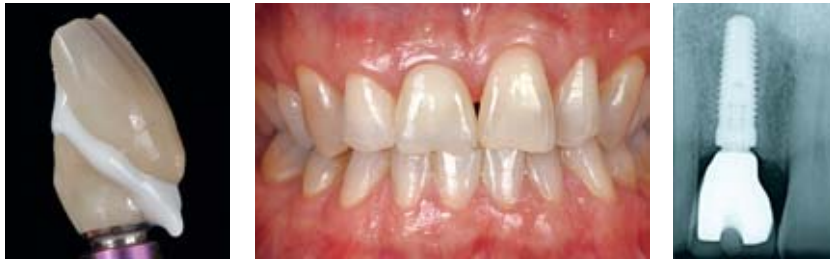
Abbildung 22–24 Über die CAD/CAM-Technik wurde ein Zirkonhybridabutment gefertigt. Das individuell verblendete Veneer wurde mit einem helligkeitssteigernden Komposit aufgeklebt. Durch die optimale Positionierung des Implantats kam der Schraubenzugangskanal palatinal zu liegen. Die Hybridabutmentkrone wurde eingesetzt.

Figure 22–24 A zircon hybrid abutment was produced by means of CAD/CAM technology. The individual veneer was bonded with a brightening composite. By ensuring an optimum insertion of the implant replacement it was possible to position the screw access canal in palatal direction. The hybrid abutment crown was then inserted.