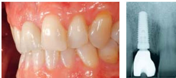
Abbildung 25, 26 Beim Follow-up nach 3 Jahren zeigt sich die Hart- und Weichgewebesituation stabil. Das ästhetische Erscheinungsbild entspricht den Vorstellungen des Patienten.

Figure 22–24 A zircon hybrid abutment was produced by means of CAD/CAM technology. The individual veneer was bonded with a brightening composite. By ensuring an optimum insertion of the implant replacement it was possible to position the screw access canal in palatal direction. The hybrid abutment crown was then inserted.