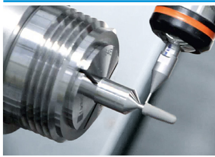
Zahnimplantate von Camlog sind hochpräzise Medizinprodukte. Der Herstellungsprozess wird lückenlos überwacht.