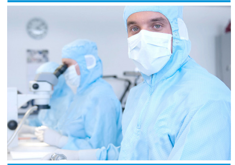
Alle Produkte werden von qualifizierten Fachkräften gefertigt, geprüft und in einem Reinraum verpackt.

Mehr Informationen über Zahnimplantate und Camlog erhalten Sie auf unserer Gesundheitsplattform 28PRO