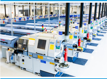
Alle Camlog Produkte werden von der ALTATEC GmbH, einem Unternehmen der Camlog Gruppe in Wirmheim, Baden-Württemberg, gefertigt.